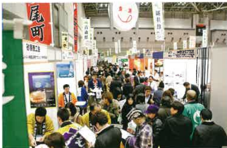
展示商談会の様子

過年度実施分を含むそれらのプロジェクトでは、事業成果を高めるために専門家を派遣し、課題解決のアドバイスや流通支援を行っています。また、この地域の取り組みを「ニッポンいいもの再発見!」ブランドとして、展示商談会や広報活動を実施。広く流通事業者へPRしています。